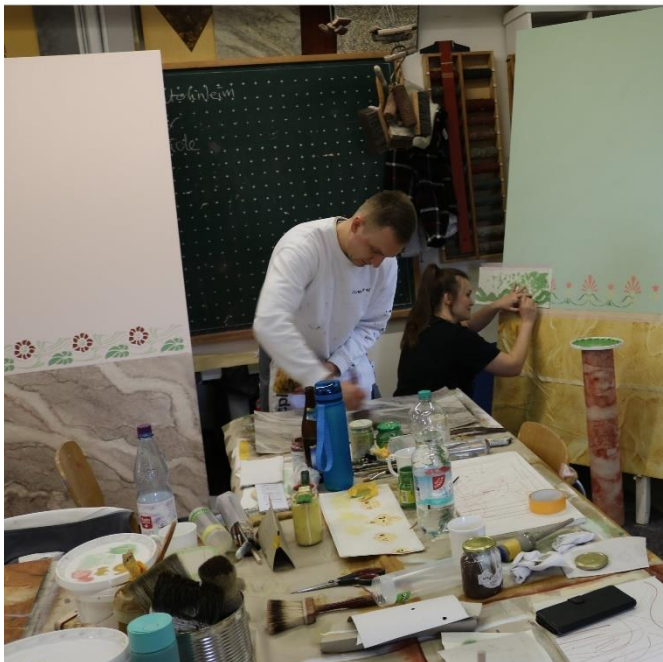
Angehende Techniker/innen bei der Gestaltung mit Leimfarben In der Malerwerkstatt der Propstei Johannesberg.